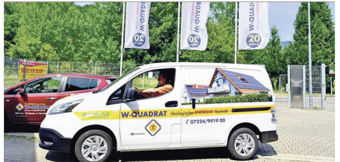
Ein Teil des elektrischen Fuhrparks in Gernsbach.