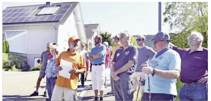
Auf einer „Watt-Wanderung“ durch Weisenbach.