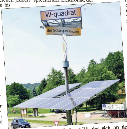
Ein Solar-Tracker mit Werbeschild, der sich an der Sonne orientiert, am Firmensitz in Gernsbach.

„Das im Jahr 2000 in Kraft getretene Erneuerbare Energie Gesetz (EEG) wurde zum Motor der Solarbranche“, erklärt