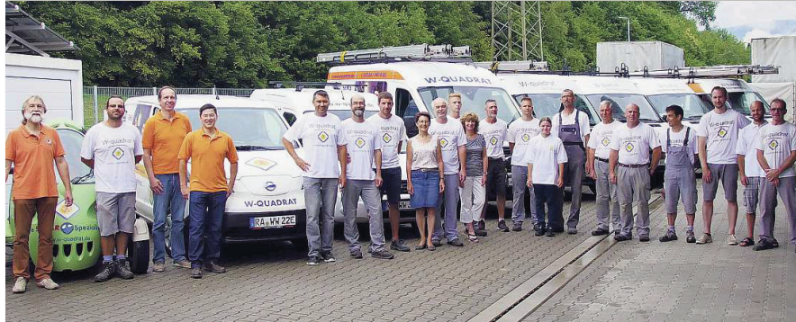
Gruppenbild: Das erfahrene Team von W-Quadrat in Gernsbach.