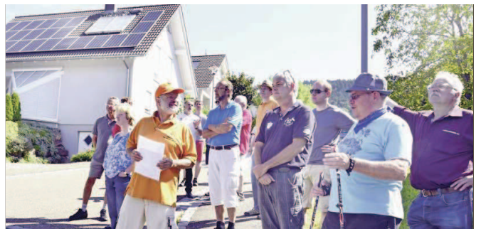
Auf einer „Watt-Wanderung“ durch Weisenbach.