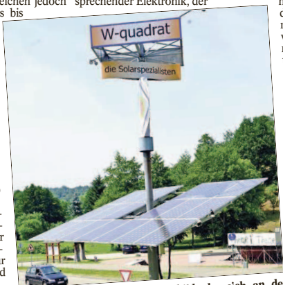
Ein Solar-Tracker mit Werbeschild, der sich an der Sonne orientiert, am Firmensitz in Gernsbach.

„Das im Jahr 2000 in Kraft getretene Erneuerbare Energie Gesetz (EEG) wurde zum Motor der Solarbranche“, erklärt