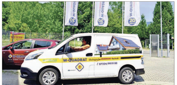
Ein Teil des elektrischen Fuhrparks in Gernsbach.

Eine Eigenentwicklung von W-Quadrat ist das Solarstrom-Speichersystem SEMS. Es ist ausgerüstet mit einem intelligenten Anlage-Management, das Sonnenstrom auch dann effektiv nutzbar macht, wenn die Sonne einmal nicht scheint. Damit wird der Eigenverbrauch an Solarstrom erhöht. Das bringt mehr Unabhängigkeit vom Netzstrom, auch lässt sich damit die Stromrechnung reduzieren.