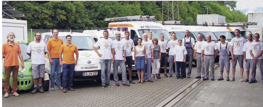
Gruppenbild: Das erfahrene Team von W-Quadrat in Gernsbach.